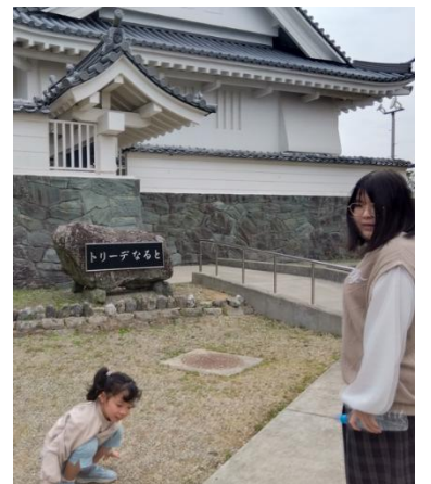
鳴門公園でお弁当を食べました。