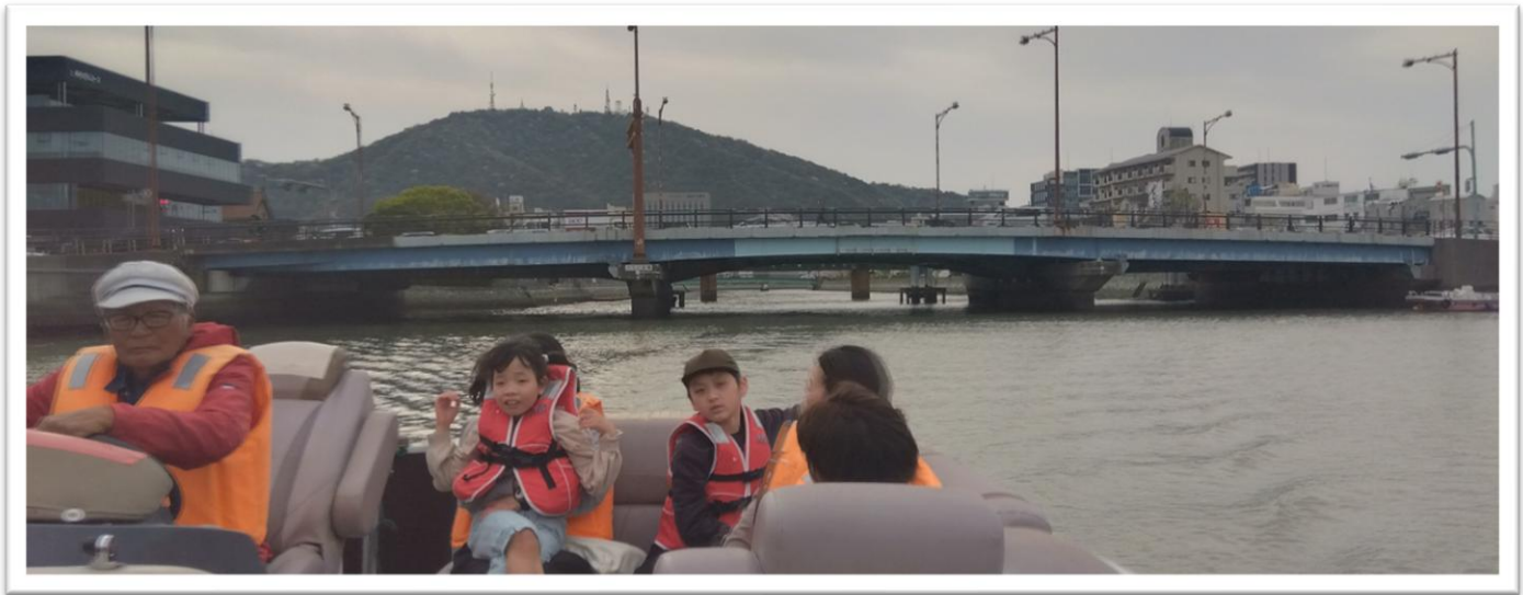
ひょうたん島クルーズ！