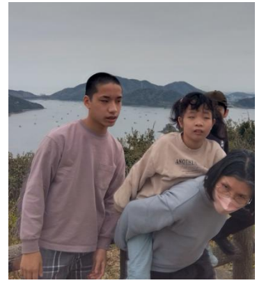
鳴門スカイライン四方見展望台