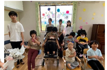
あわっ子たちの様子